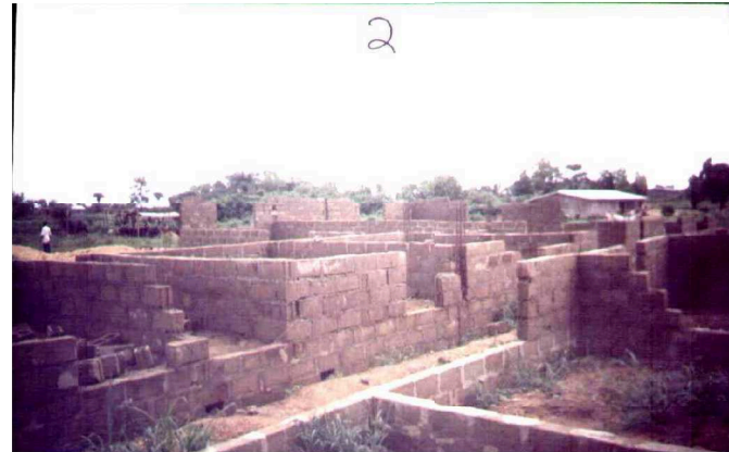
Schulrohbau, Juli 2009.