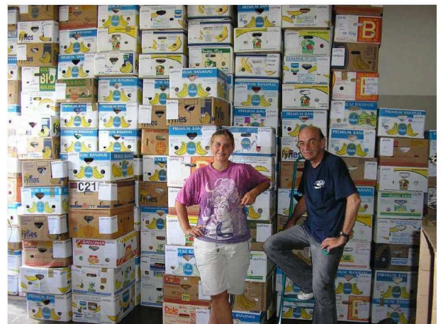
Sachspenden werden sortiert, verpackt, gelagert

Räumlichkeiten, die wir nutzen, sind über den DRK Kreisverband versichert.