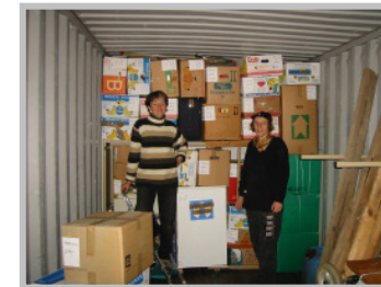
Sachspenden in Containern nach Liberia verschicken

Auf Flohmärkten verkaufen, was nicht für Liberia geeignet ist