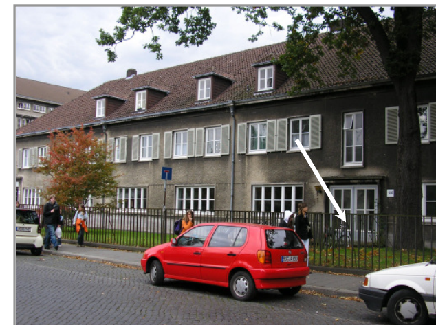
Lager für Sachspenden Grünwaldstr. 12 E / Kellerräume 38104 Braunschweig